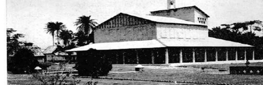
Kerk van het Seminarie.