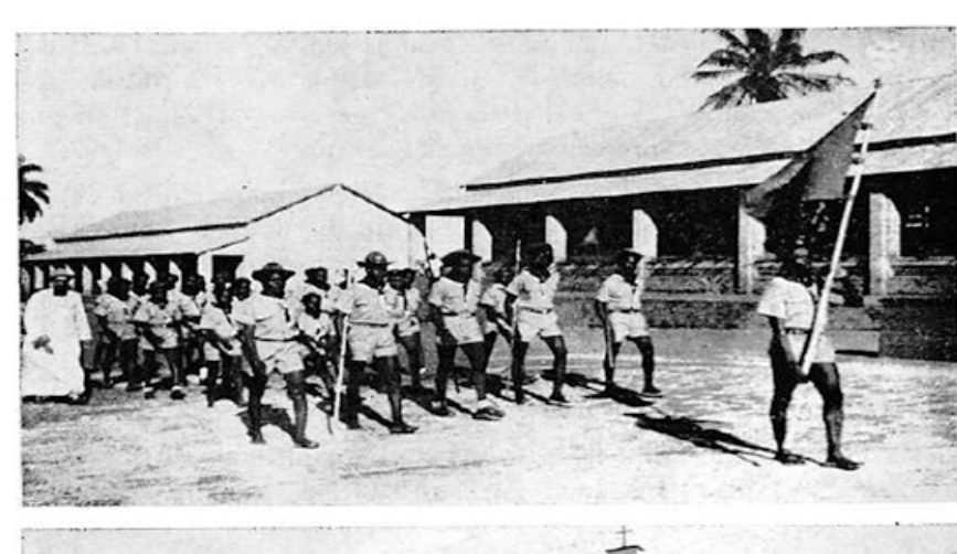
Scoutsdefilé en schoolgebouwen te Bondo.