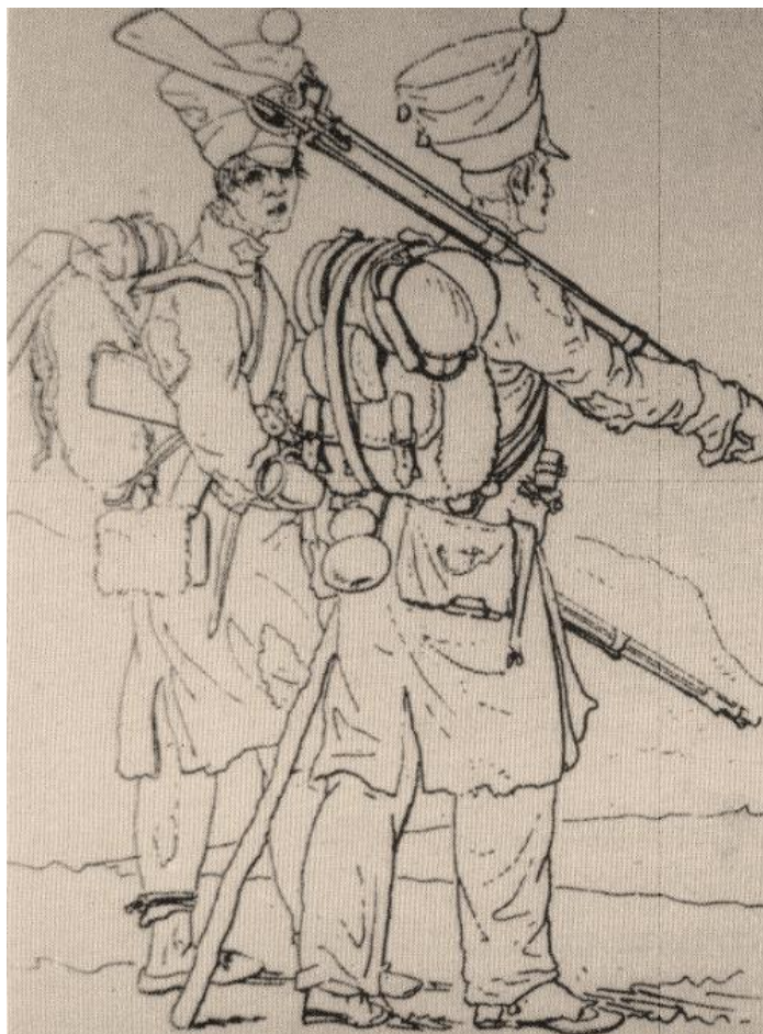
Louis LETEN, amateurhistoricus