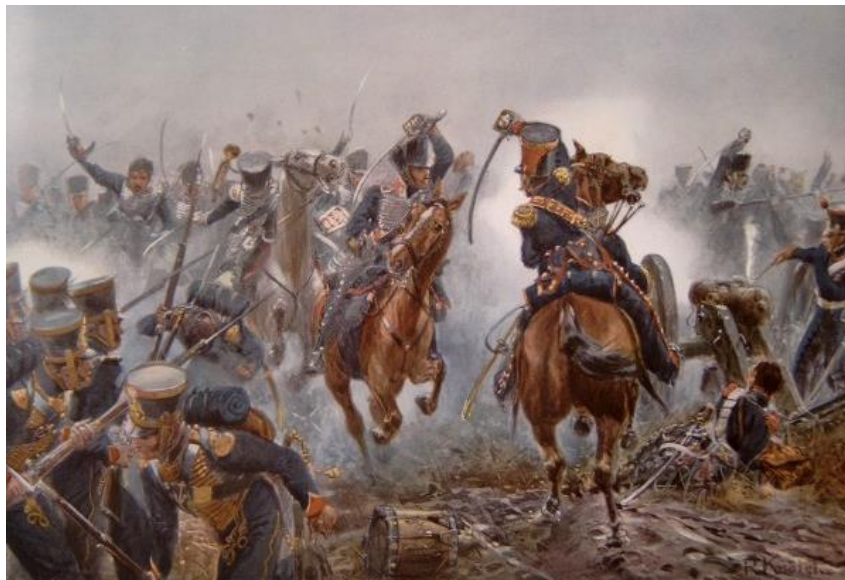
Volkerenslag bij Leipzig op 16 tot 19-10-1813

Tenslotte tijdens de Volkerenslag bij Leipzig op 16 tot 19-10-1813 namen ze deel aan de grote cavalerie-aanval van Murat waarbij 60 ruiters sneuvelden.