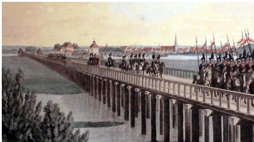
Brug van Harburg naar Hamburg

Ondanks de steeds afnemende mankracht, voedsel- en munitievoorraden maakten Davout's troepen geen aanstalten om de stad te verlaten.