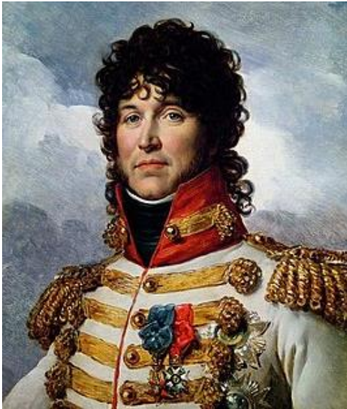
Joachim Murat (1767-1815)

Hij was de zoon van een herbergier en werd Maréchal de France (1804), Prince de l'Empire (1805) en Grand Duc de Berg (1806) en van 15-07-1808 tot 03-05-1815 was hij koning van Napels. Hij was gehuwd met Caroline Bonaparte, de jongste zuster Napoleon.