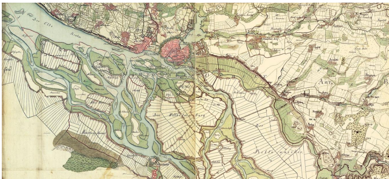
Kaart van Hamburg met de talrijke eilanden in de Elbe (1790)

Na de Russische veldtocht van 1812 werd dit regiment opnieuw opgevuld. Het 1 ste Bataljon bestond uit de overlevenden van Rusland, het 2 de werd gevormd in Erfurt DE , de andere in Hamburg. De stad had één van de machtigste forten aan de Elbe. Ze was in 1806 in Franse handen gevallen.