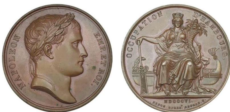
Bronzen medaille uitgegeven ter gelegenheid van de bezetting van Hamburg door de Fransen in 1806