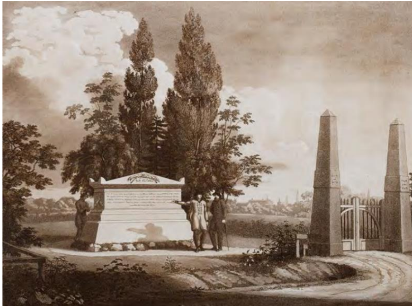
Gedenksteen uit 1815 te Ottensen voor 1 138 omgekomen Hamburgse inwoners, tekening door Siegfried Bendixen.

Om de belegering van de stad te kunnen overleven, werd bevolen dat vanaf november 1813 elk huishouden voor 6 maanden voedsel moest hebben. De stad had echter al snel een tekort aan voorraden, nadat ze vanaf december belegerd was. Op kerstavond 1813 werden mannen, vrouwen en kinderen die niet in staat waren om de vereiste voorraden aan te leggen, eerst in kerken bijeengebracht en vervolgens, op kerst- en tweede kerstdag, uit de stad verbannen. Velen van hen stierven. Alleen al in Ottensen 31 lag een massagraf voor 1 138 personen, die in het naburige Altona stierven nadat ze in de winter van 1813-1814 werden verbannen. Tot eind maart werden in totaal 30 000 mensen verbannen.