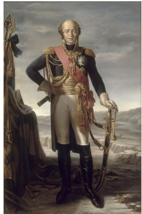
Louis Nicolas Davout, Duc de l'Empire, Maréchal de France (1770-1823)

Na de hervatting van de vijandelijkheden op 12-08-1813 sloten de Oostenrijkers bij de Coalitietroepen aan. Er vonden in Duitsland nog tal van veldslagen plaats waarbij de Coalitie en de Fransen beurtelings wonnen en verloren, tot Napoleon de Volkerenslag bij Leipzig op 16 tot 19-10-1813 verloor en de Franse troepen zich op hun grenzen terugtrokken. Vanaf dan waren Hamburg en andere versterkte plaatsen in Duitsland op hun eigen verdediging aangewezen.