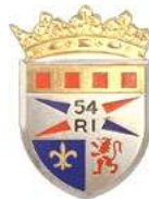
Kenteken 54 ste Infanterie Regiment

Hij was jager in het 54 ste Infanterie Linie Regiment, 10 de Bataljon, 4 de Compagnie en sneuvelde op het slagveld bij Talavera ES op 28-07-1809, 21 jaar oud.