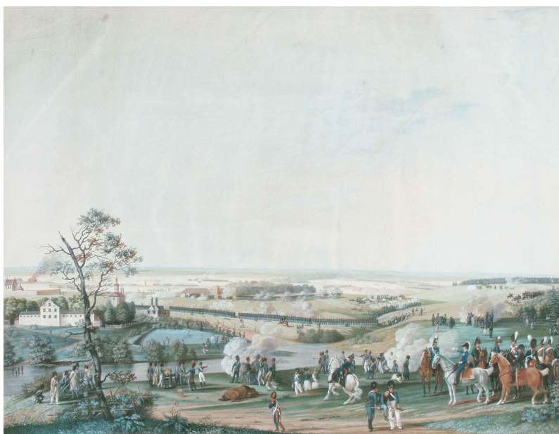
Eerste slag bij Polotsk

Enkele maanden later vond er bij Polotsk een 2 de slag plaats tussen de Russen onder generaal Peter Wittgenstein en een Frans-Beierse troepenmacht onder maarschalk Laurent Gouvion Saint-Cyr. Ditmaal wonnen de Russen, namen Polotsk in en stopten definitief de opmars van Napoleon in Wit-Rusland. Wittgensteins overwinning was de aanloop naar de slag bij Berezina in november, waarin drie Russische legers Napoleon uit verschillende richtingen aanvielen.