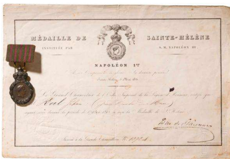
Voorbeeld van een gepersonaliseerd diploma